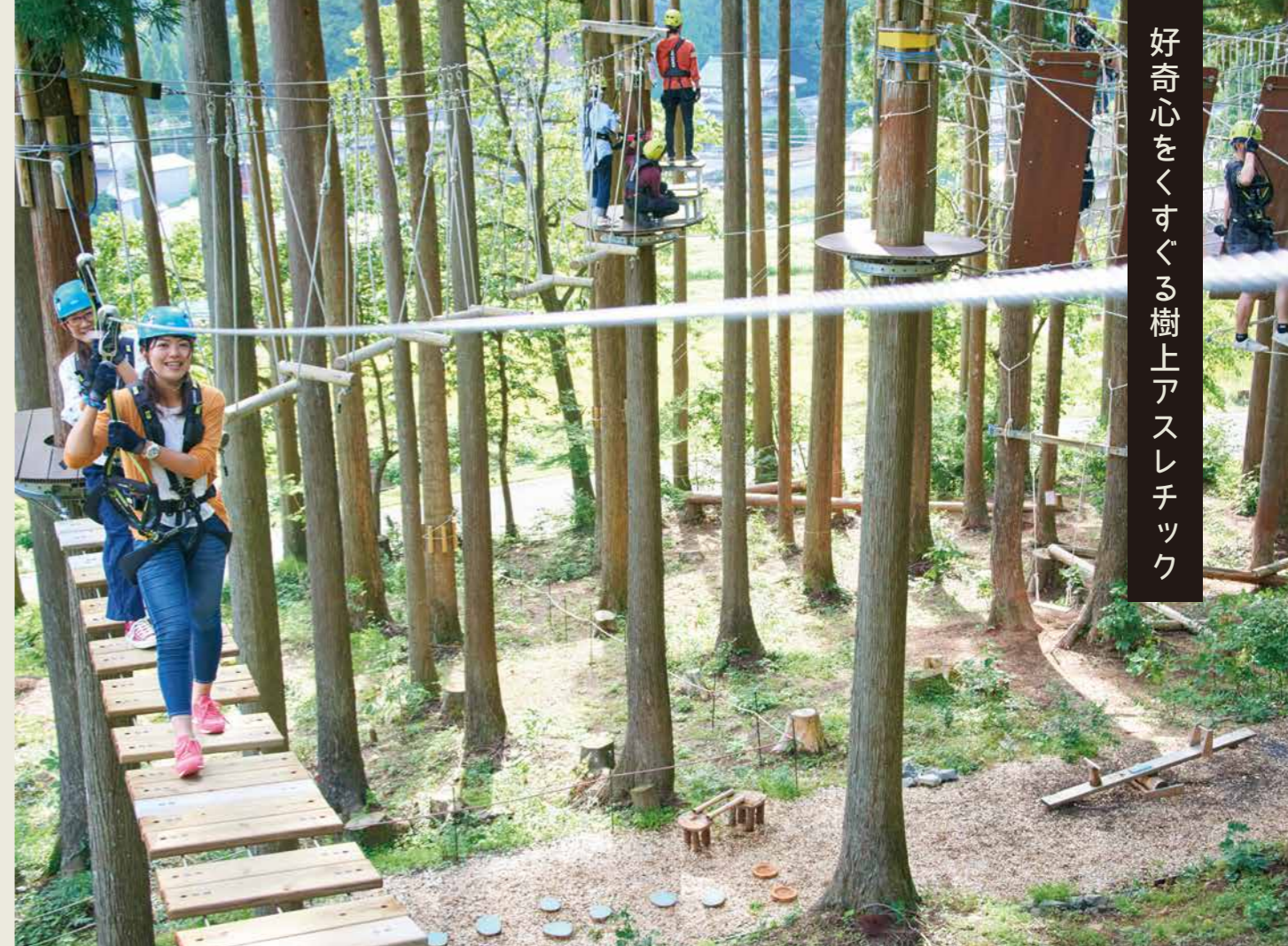
好奇心をくすぐる樹上アスレチック