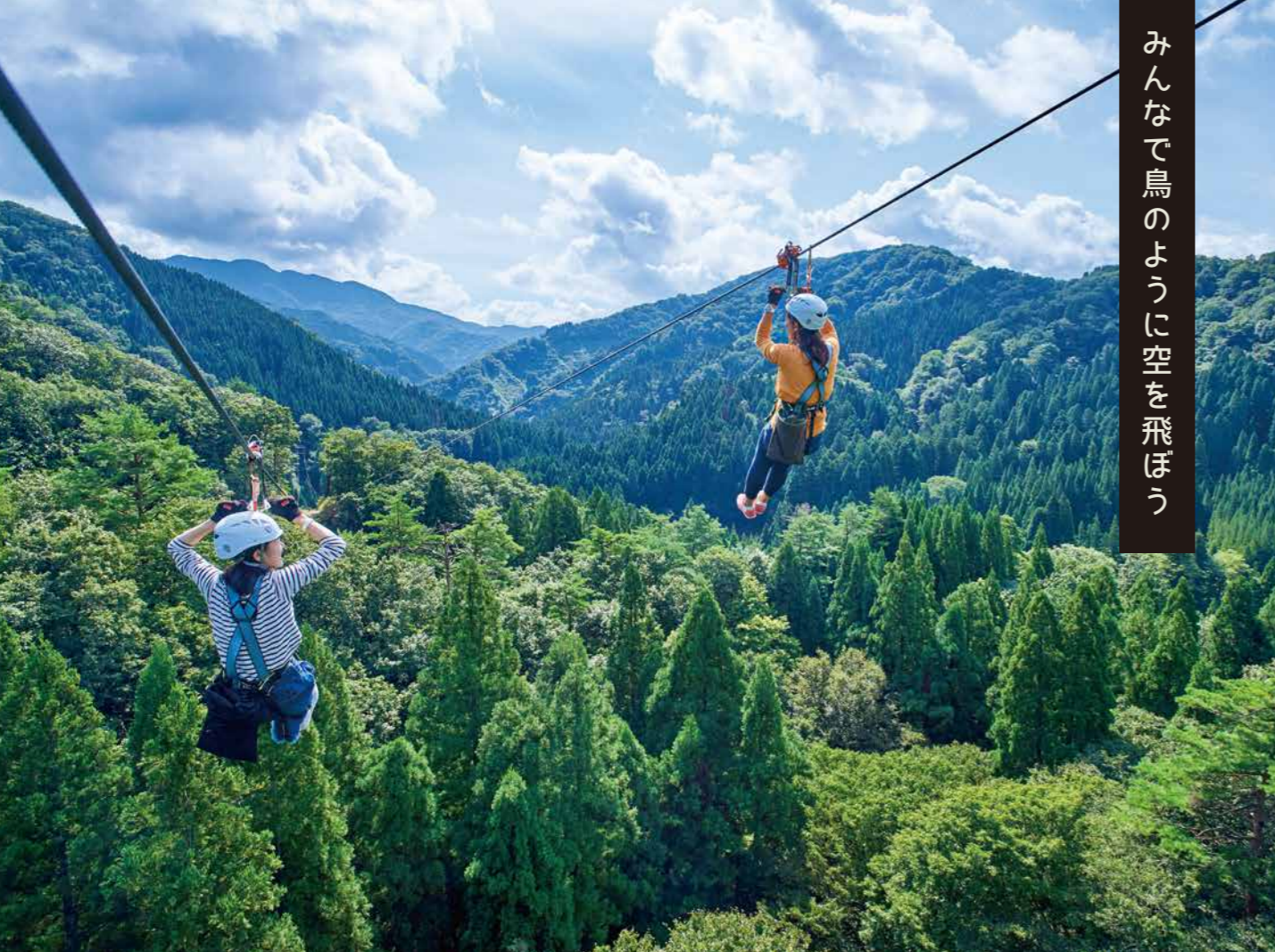
みんなで鳥のように空を飛ばう